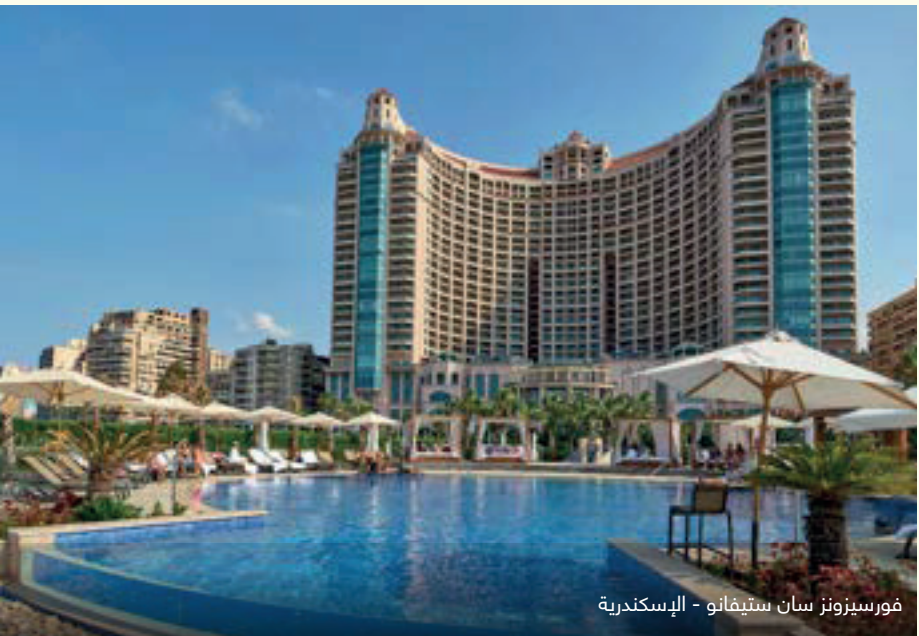
فورسيونز سان ستيفانو - الإسكندرية