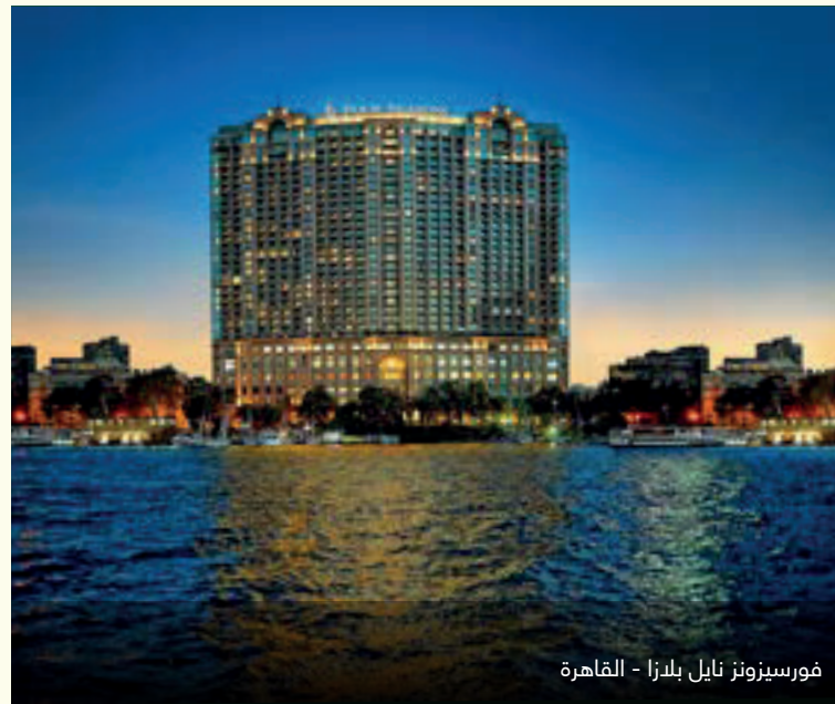
فورسيونز نايل بلرا - القاهرة