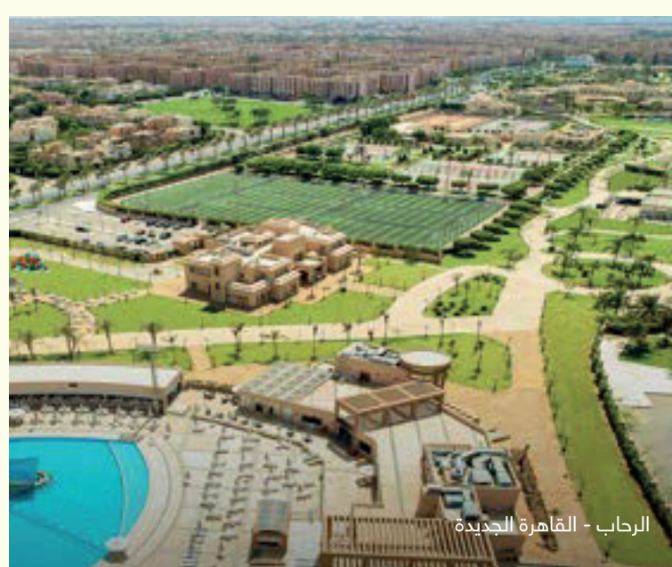
الرحاب - القاهرة الجديدة