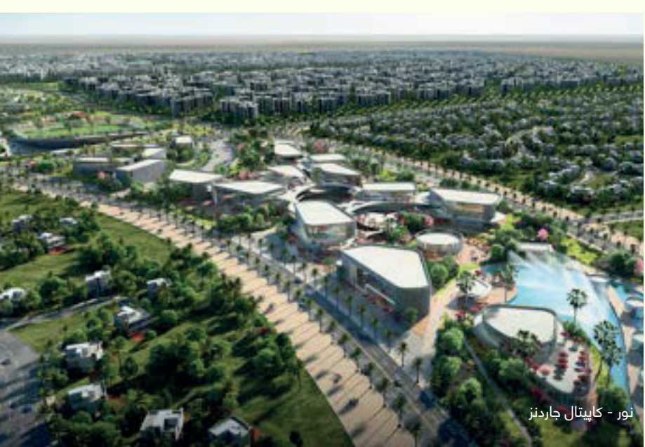
نور - كايبتال جاردنز