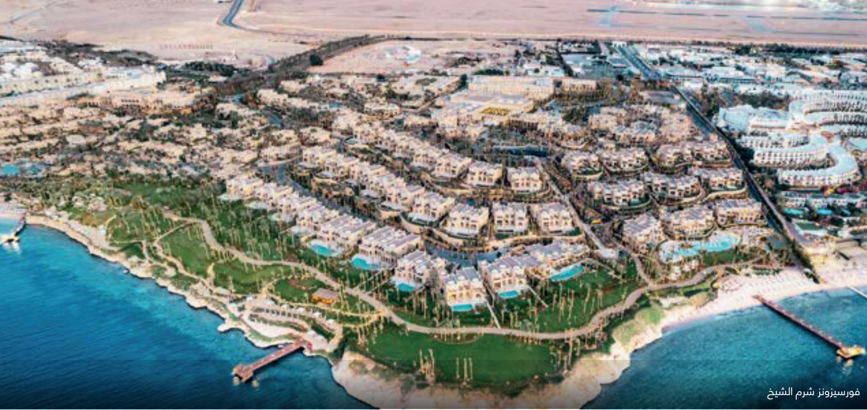
فورسيونز شرم الشيخ